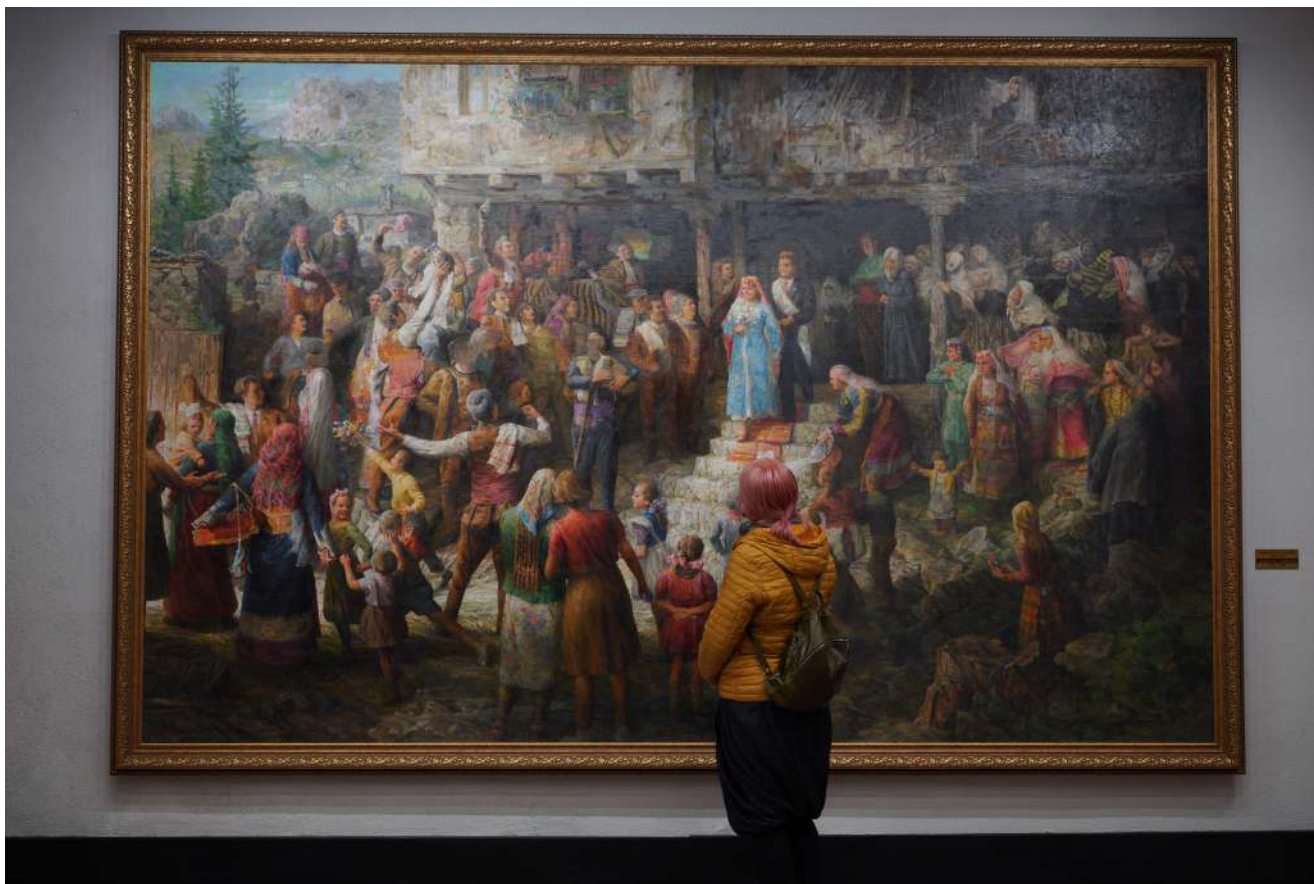
„Мома се с рода прощава“/ “Родопска сватба“ (1958) художник: Анастас Стайков